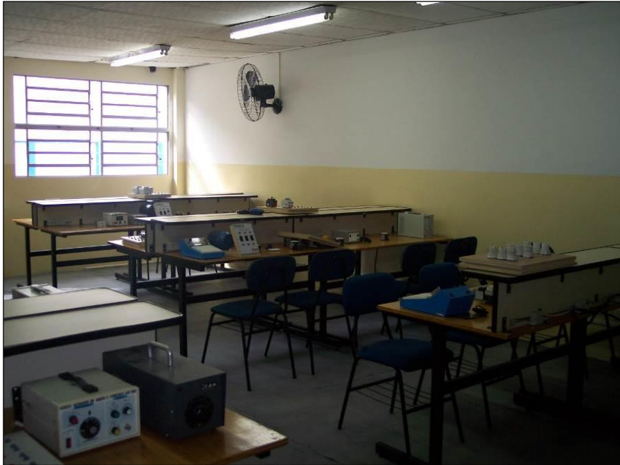
Figura 16 – Vista parcial do Laboratório 01 – Eletrônica Digital e Microprocessadores.