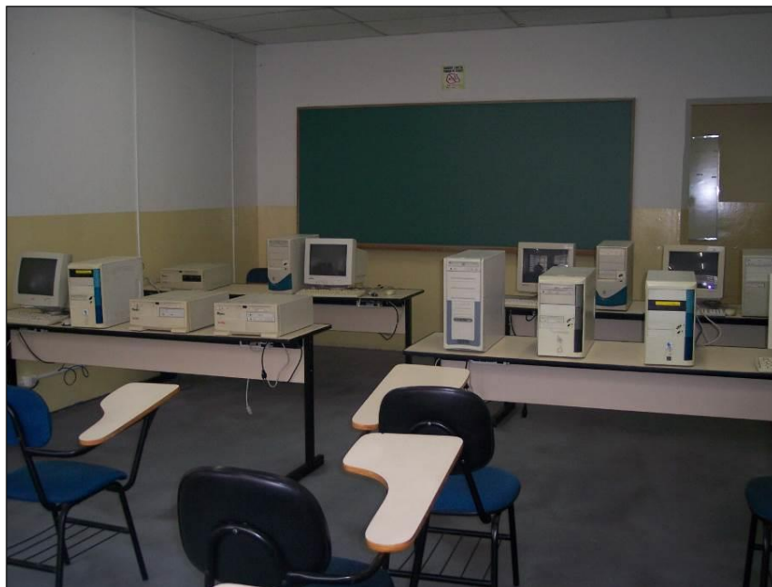
Figura 17 – Vista parcial do Laboratório 02 – Arquitetura de Computadores.

A figura a seguir mostra uma foto parcial do Laboratório 02 – Arquitetura de Computadores.