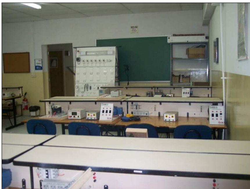
Figura 20 – Vista parcial do Laboratório 07 – Eletricidade, Eletrônica Analógica e de Potência.

A figura a seguir mostra uma foto parcial do Laboratório 07 – Eletricidade, Eletrônica Analógica e de Potência.