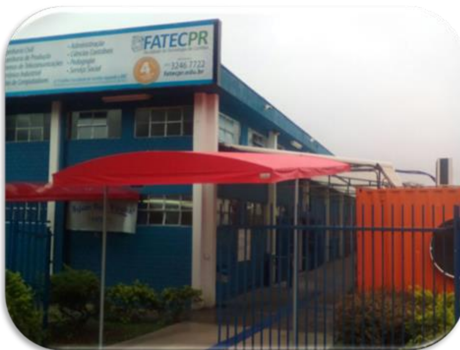
Figura 01 – Foto da Faculdade de Tecnologia de Curitiba – FATEC-PR.