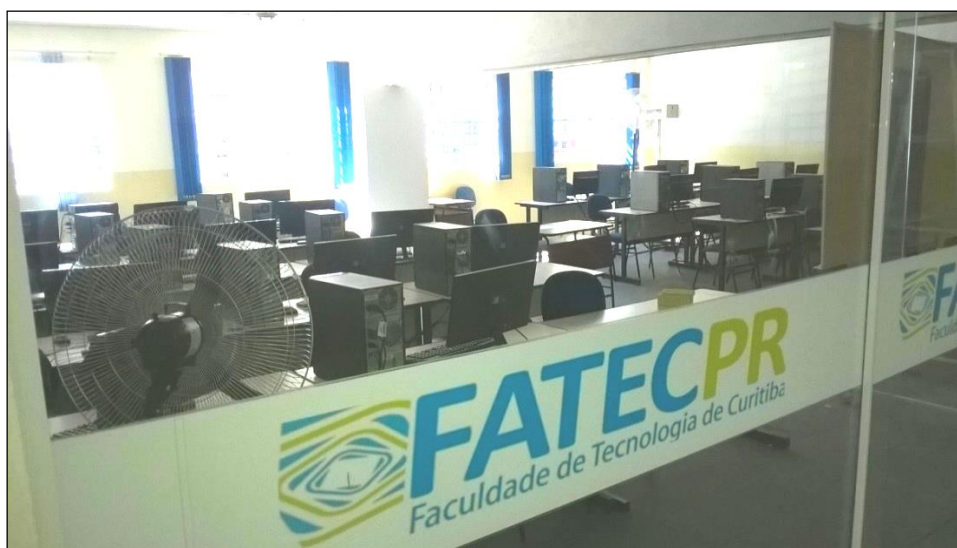
Figura 19 – Vista parcial do Laboratório de Informática e Redes de Computadores que engloba o Laboratório 04 e 05.

A figura a seguir mostra uma foto parcial dos laboratórios de informática, onde houve troca de equipamentos, aumento do espaço com instalação de parede de madeira sanfonada de modo que se possa usar os dois laboratórios ao mesmo tempo, o antigo Laboratório 04 e 05.