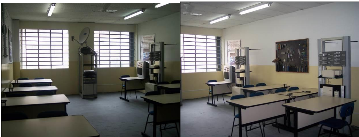
Figura 18 – Vista parcial do Laboratório 03 – Telecomunicações e Cabeamento.

A figura a seguir mostra uma foto parcial do Laboratório 03 – Telecomunicações e Cabeamento.